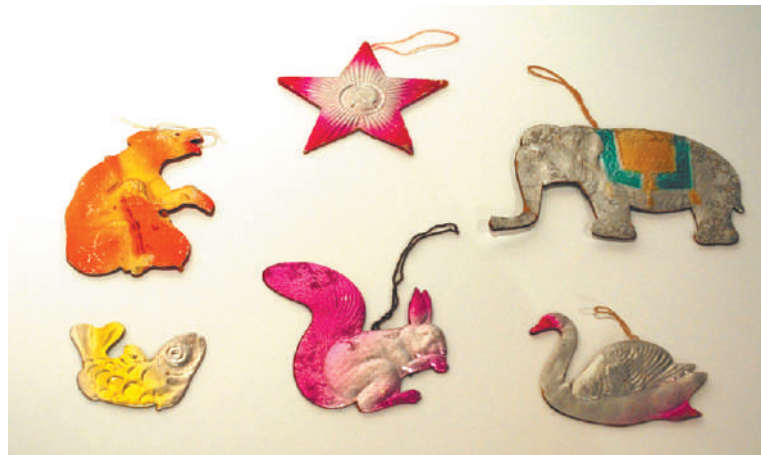
Картонные игрушки 1950-х годов