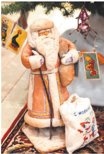
Дед Мороз, 1958 г. Пушкинская фабрика ёлочных игрушек

Сотрудники отдела «История и культура Сергиево-Посадского края XX века» собирают и хранят разнообразные ёлочные украшения, принадлежавшие жителям Сергиева Посада. На сегодняшний день в фондах отдела хранятся около ста ёлочных игрушек и новогодних сувениров, датированных разными периодами XX века. Среди них картонажные, стеклянные, авторские игрушки, коробки из-под новогодних подарков с кремлёвской ёлки, подставочные Деды Морозы и другие новогодние фигурки.