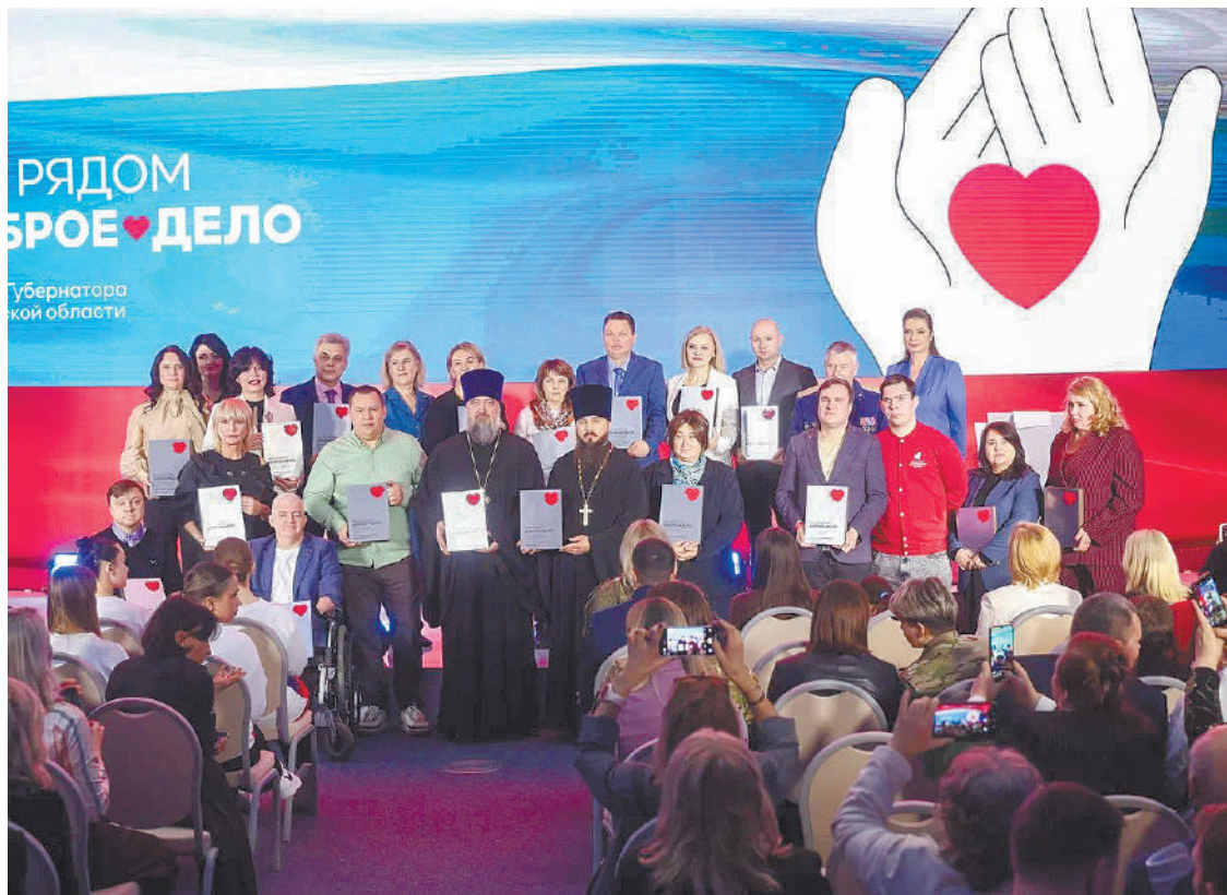
Лауреатами в номинации «Доброе дело» стали супруги